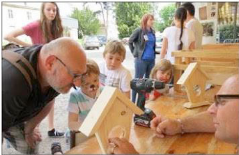
■ Des ateliers pour se divertir en famille comme ici des nichoirs proposés par le service espaces verts de la ville.

LA CLEF (collectif lunévillois enfance famille) et le CCAS de Lunéville ont monté la première édition. Une journée des familles, pour présenter et informer sur les structures et associations destinées aux enfants et aux familles sur Lunéville. Mais aussi se divertir. C'était en 2011. Une deuxième édition a été organisée deux ans après. La CAF avait souhaité l'élargir au Lunévillois : c'est chose faite avec ce 3 e opus et la participation de 45 partenaires (des institutions et associations). Histoire de ne pas tout concentrer sur la sous-préfecture, elle a eu lieu en deux temps : à Aze-railles le 30 avril et hier à Lunéville.