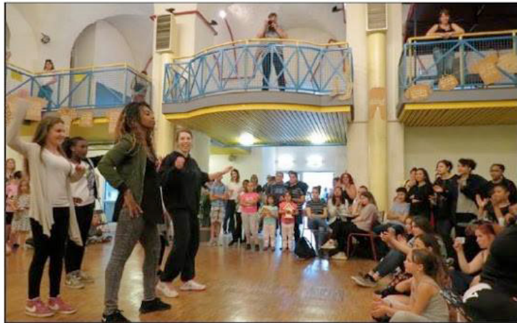
■ Des spectacles ponctuaient cet après-midi d'informations et de jeux pour petits et grands.

continuent à fréquenter ces structures toute l'année », explique l'une des organisatrices. Mais aussi s'amuser. Comme avec l'atelier jardinage de Familles rurales d'Einvile. « Il y a beaucoup d'ateliers parents-enfants pour qu'ils prennent un peu le temps de se poser avec leurs enfants. Et cela leur donne des idées d'activités à faire ensemble », ajoute une autre. Les jeux surdimensionnés, la tente sensorielle, les espaces de jeux de société et l'atelier maquillage, entre autres, n'ont pas désempli. A l'extérieur, des familles profitaient des transats pour un voyage à travers des paysages sonores lorrains, proposé par la cité des paysages de Sion. A côté, d'autres maniaient la visseuse pour fabriquer des nichoirs avec les agents du service espaces verts de la