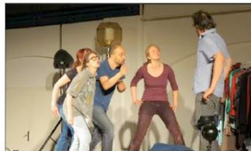
■ « Tu mets ton enfant à la crèche ? Tu es carriériste ! », crient les artistes de la compagnie ClicClac.

Des spectacles de danse hip-hop de jeunes de l'Asal et de la MJC, une flash mob (avec une chorégraphie à apprendre avant sur la mezzanine), une création d'autres ados, étaient aussi proposés. Pour cette journée, la compagnie messine ClicClac avait écrit « Les familles du territoire ont des choses à dire », fruit de neuf rencontres avec des jeunes et moins jeunes de tout le Lunévillois. Un spectacle sur la parentalité, truffé de situations bien réelles (pour ou contre l'allaitement au sein, il y aura toujours quel-