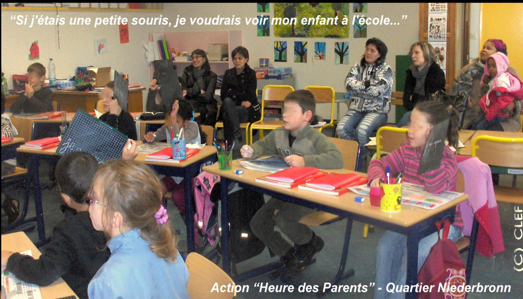
Action "Heure des Parents" - Quartier Niederbronn

"Si j'étais une petite souris, je voudrais voir mon enfant à l'école..."