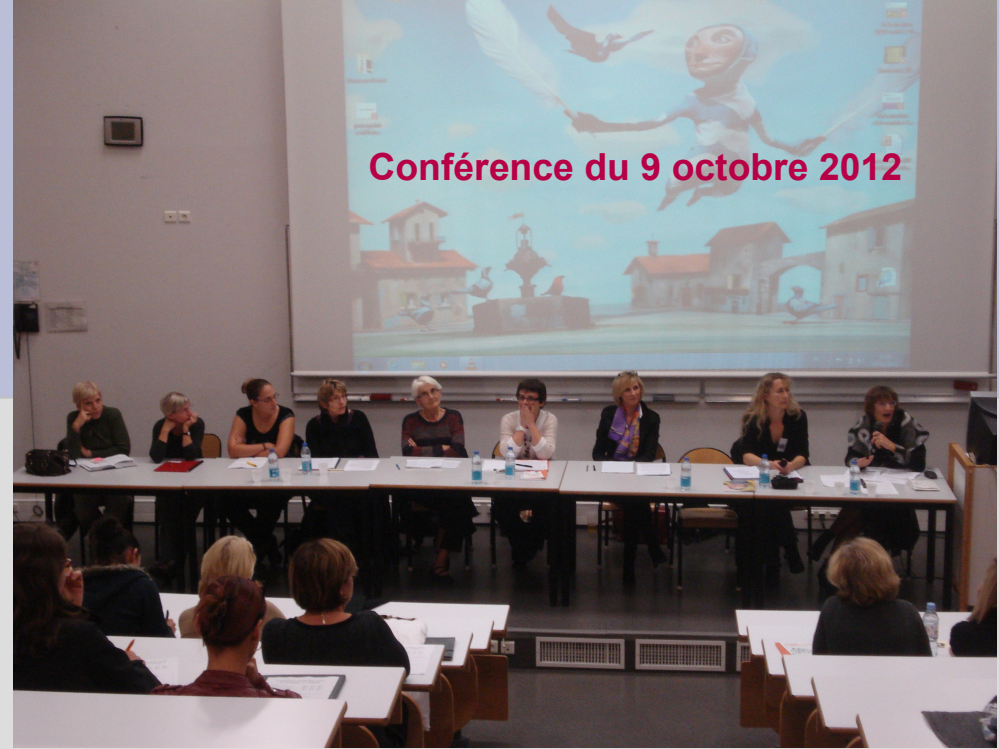
Première rencontre des professionnels, bénévoles et élus agissant auprès de la famille