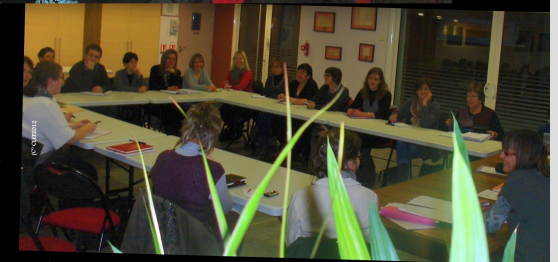
Le 24 janvier 2012 Blainville, Damelevières, Mont sur Meurthe, Rehainviller et Xermaménil

Rôle de la CLEF : soutien à la mise en réseau des acteurs et fonction de pôle ressources