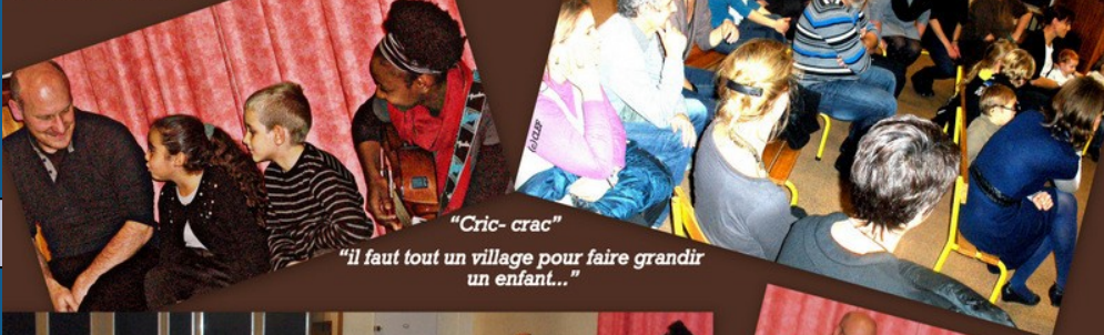
"Cric-crac" "il faut tout un village pour faire grandir un enfant..."