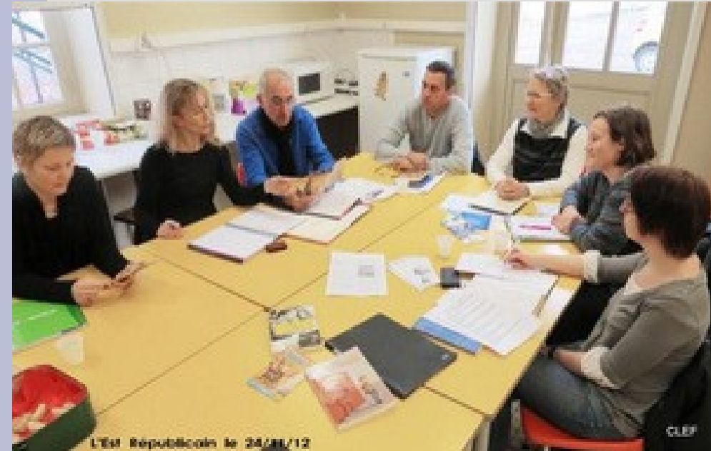
L'Est Républicain le 24/11/12