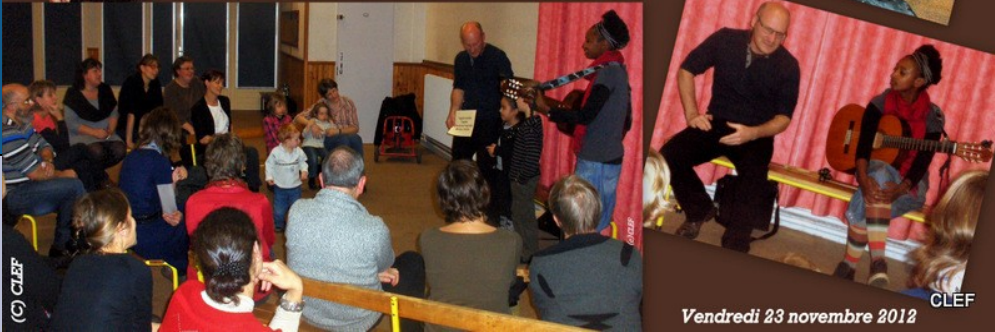
Vendredi 23 novembre 2012