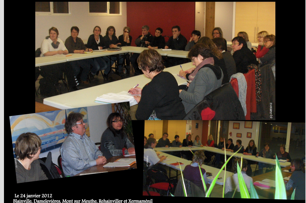
Le 24 janvier 2012 Blainville, Damelevières, Mont sur Meuthe, Rehainviller et Xermaménil