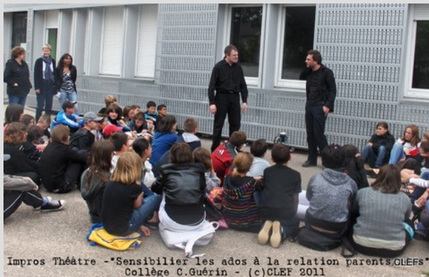
Impros Théâtre - "Sensibiliser les ados à la relation parents/ados" Collège C. Guérin

Grandir avec les jeunes, c'est répondre à ces questions.